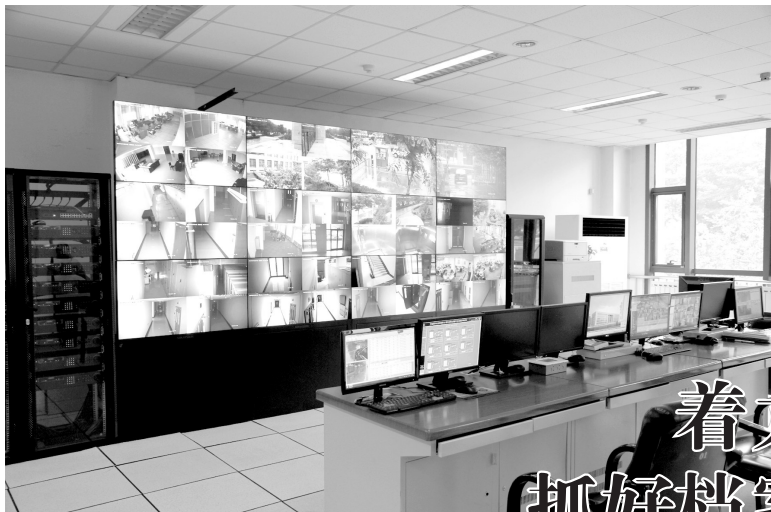
图为自治区和银川市档案馆中心机房