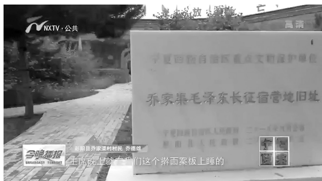
乔家渠毛泽东长征宿营地旧址剧照