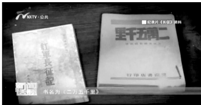
《二万五千里》《红军长征记》两本书剧照

自己在长征中所经历的战斗、民情风俗、奇闻轶事写下来。征文启事获得积极响应。两个月后，编辑部收到二百多篇稿件，共五十多万字。文章于1937年2月结集出版，书名为《二万五千里》，再版时更名为《红军长征记》。