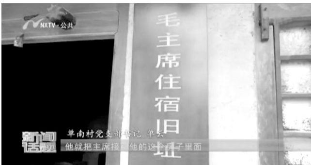
毛主席住宿旧址剧照