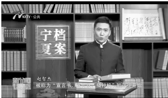
《档案宁夏·长征》第一集《单家集夜话》片头剧照